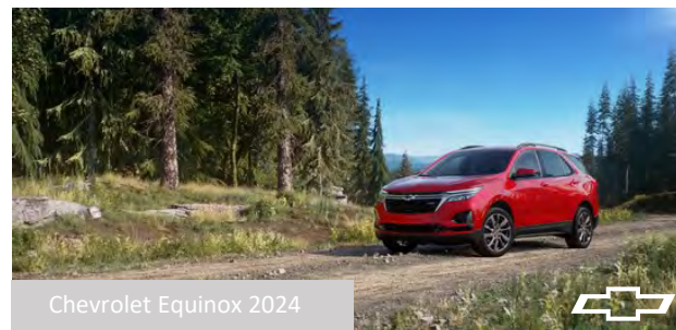
Chevrolet Equinox 2024