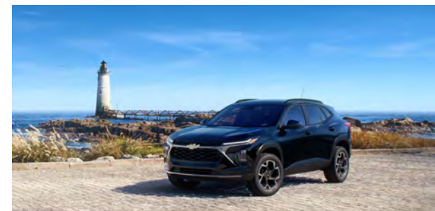
Chevrolet Trax 2024