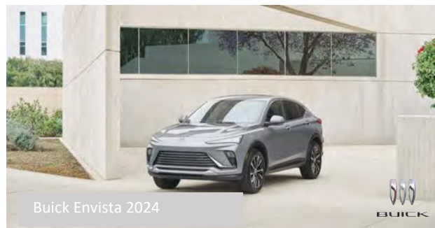
Buick Envista 2024