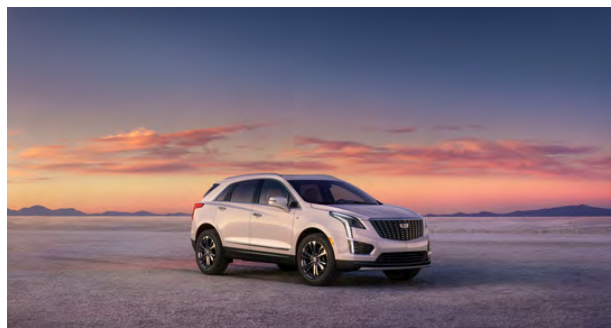
Cadillac XT5 2024