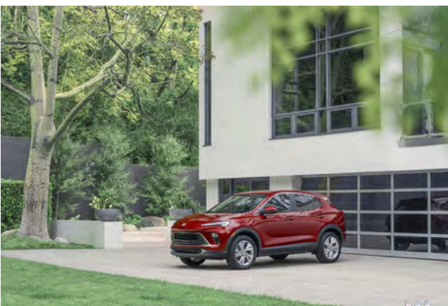
Buick Encore GX 2024

*Offre de prix préférentiel pour les employés actuels des entreprises autorisées par GM (sauf les retraités, les employés contractuels ou temporaires) sur l'achat au détail ou la location de véhicules neufs admissibles Chevrolet, Buick, GMC ou Cadillac d'ici le 2 janvier 2025. Des exclusions de véhicules s'appliquent. Obtenez les détails du programme et votre code d'autorisation de prix préférentiel sur https://www.gmpreferredpricing.ca/french . Apportez votre code d'autorisation chez un concessionnaire GM participant pour obtenir le calcul de votre prix préférentiel. Une preuve d'admissibilité est exigée. GM se réserve le droit de modifier ou de mettre fin au programme en tout ou en partie, sans préavis.