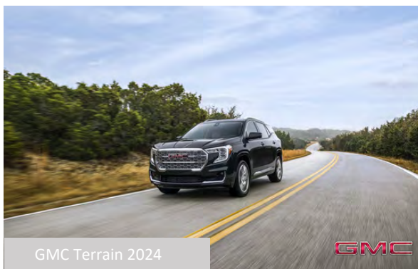
GMC Terrain 2024

Pour obtenir de plus amples renseignements, composez le 1 866 410-1622