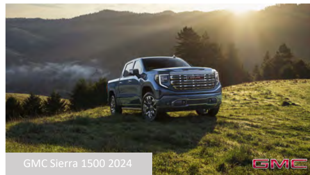
GMC Sierra 1500 2024