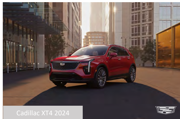
Cadillac XT4 2024