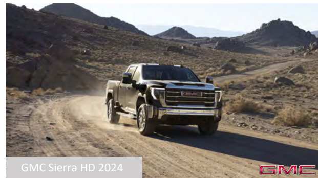
GMC Sierra HD 2024